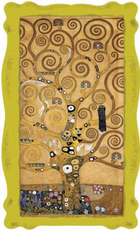
El árbol de la vida GUSTAV KLIMT